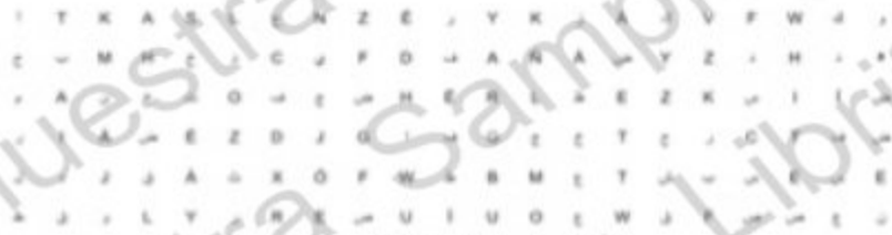
Colors - Colores - الألوان